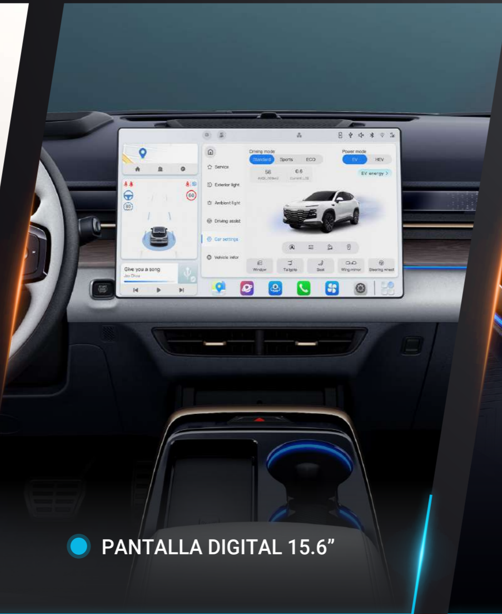
● PANTALLA DIGITAL 15.6"