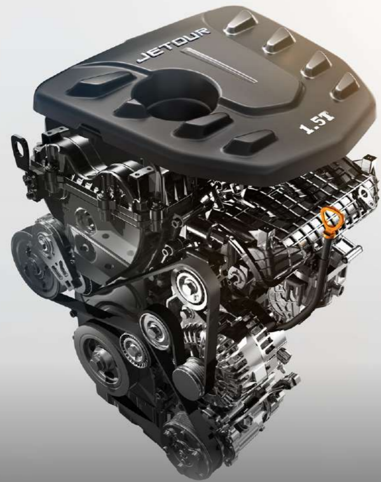
● MOTOR 1.5T Y 1.6T GDI

La tecnología de Jetour Dashing va más allá gracias al sistema de cierre y apertura automático "KEYLESS". Con 2 opciones de motorización , 1.5T y 1.6T GDI, no habrá ruta sin recorrer.